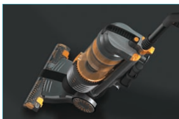
Модель Vax Mach Air, созданная в Pro/ENGINEER.