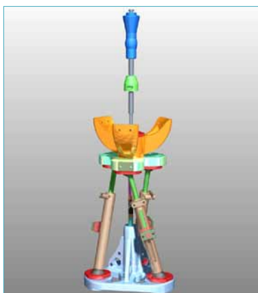
Все работы по проектированию механизма плеча антропоморфного робота выполнялись в программе Pro/ENGINEER.